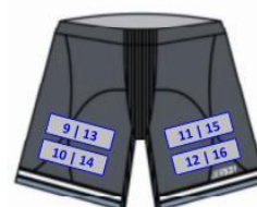
Voorzijde (9, 10, 11, en 12) en achterzijde (13, 14, 15 en 16) Dutch Flyers overbroek

Bovenstaand enkele voorbeelden van positionering op de kledingstukken.